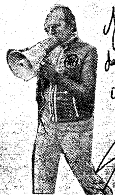
Je tâcherai de moins crier cette saison