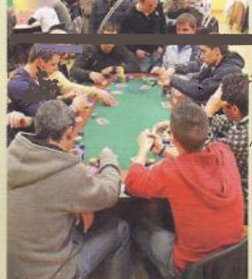
Parmi de nombreux événements, la salle des fêtes accueille chaque année le tournoi de poker de la toute jeune association Benjamin Guillard.

Centre Léonard de Vinci ainsi que de la construction de 2 extensions pour l'accueil / bar et des pièces de rangement. Et depuis sa création, son succès ne se dément pas. Il faut dire que la salle des fêtes a la particularité d'être prêtée gratuitement par la municipalité à toutes les associations de Feyzin et aux habitants qui en font la demande (hormis pour des manifestations commerciales ou culturelles). En 2012, il y a ainsi eu