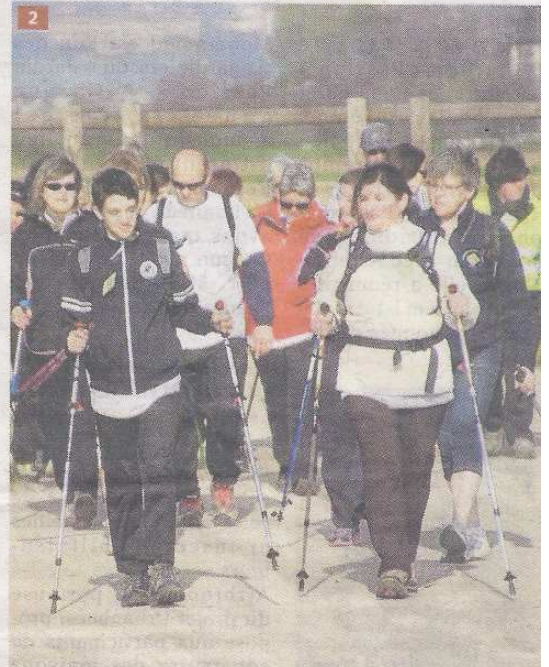
1 Beaucoup de jeunes participants ont préféré le 6km au 3km.