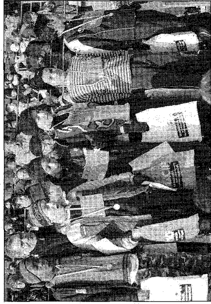
Les garçons récompensés de la catégorie 1997